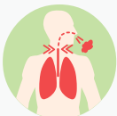
Tos perruna, voz ronca, pitidos y dificultad al respirar