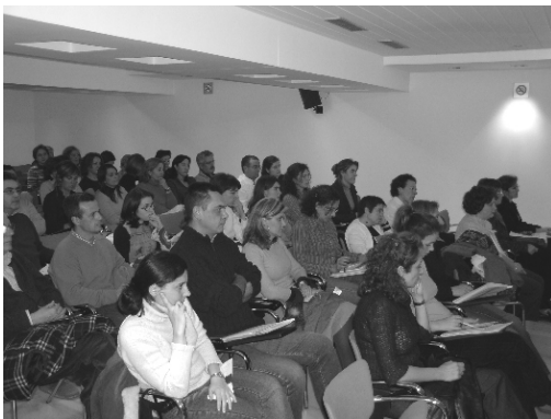
Las Enfermeras Comunitarias de Huelva trabajan por el reconocimiento de sus competencias profesionales

ASANEC continúa apostando por la formación científica y la promoción de actitudes profesionales constructivas, bases fundamentales en la consolidación de cualquier disciplina.